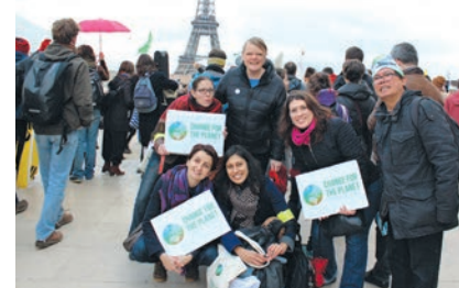
Une partie de notre délégation en compagnie des membres de CIDSE (alliance internationale d'agences de développement catholiques).