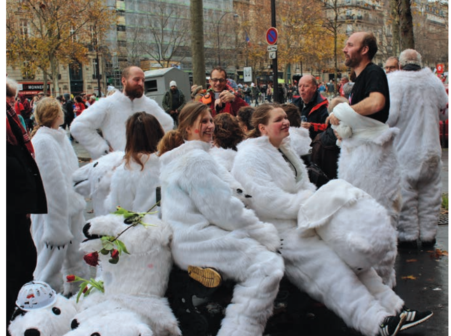
La COP 21 était aussi l'occasion de côtoyer des militants de partout dans le monde.