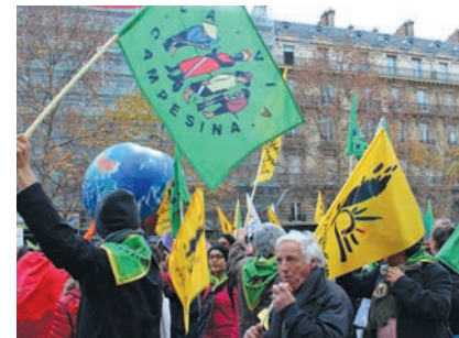
La Via Campesina est un mouvement international qui défend l'agriculture durable de petite échelle comme moyen de promouvoir la justice sociale et la dignité.