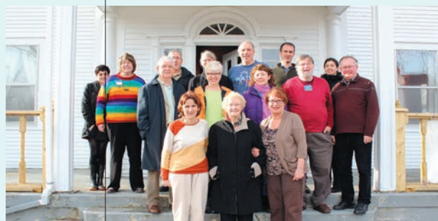
Assemblée régionale de Terre-Neuve.