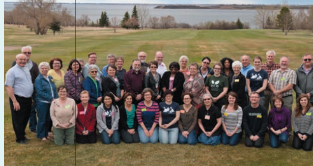
Assemblée régionale de la Saskatchewan.

Véritables espaces de partage et de mobilisation, les assemblées régionales qui se sont déroulées au printemps 2016 ont réuni plus de 300 membres dans les différentes régions du Canada. Il s'agit d'un espace de dialogue et d'échange qui reflète la nature réellement démocratique du mouvement. C'est dans le partage d'information et l'écoute des préoccupations exprimées par les membres à la base que des recommandations et résolutions sont formulées et communiquées au conseil national, la plus haute instance décisionnelle de l'organisme.