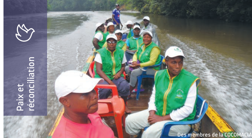
Des membres de la COCOMACIA

La paix et le développement sont des réalités interdépendantes. La paix est un pilier central de la construction de sociétés plus justes, riches de leurs diversités. Nous travaillons à promouvoir la paix par le biais d'initiatives concrètes favorisant le dialogue, la compréhension et l'acceptation de l'autre et le règlement pacifique des conflits.