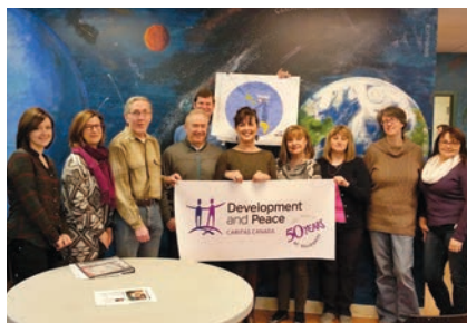
St. John (Terre-Neuve)